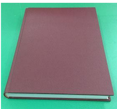
Ganzgewebeband ohne Prägung à Fr. 65.00 (optionale Prägung: + à Fr. 15.00/Zeile)

Dauer: innert 3 Tagen (2 Nächte Trocknungszeit) Express innert 24 Stunden möglich