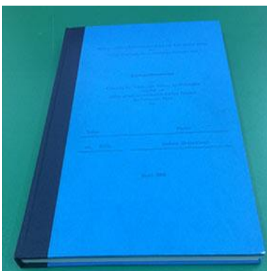
Halbgewebeband à Fr. 63.00