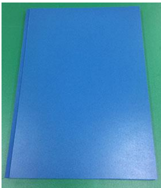
Pressspandekkel ohne Kaschierung à Fr. 32.00

Dauer: innert 24 Stunden (1 Nacht Trocknungszeit)