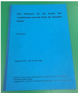
Pressspandekkel mit bedruckter Kaschierung à Fr. 34.00

4.) Bucheinband (Hardcover) : verstärkte Klebebindung, Ganzgewebeband mit oder ohne Prägung | Halbgewebeband mit bedrucktem Deckelüberzugspapier.